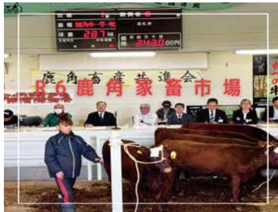
秋期子牛市場セリの様子