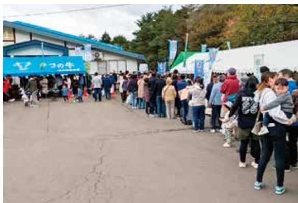
精肉を求める長蛇の列!