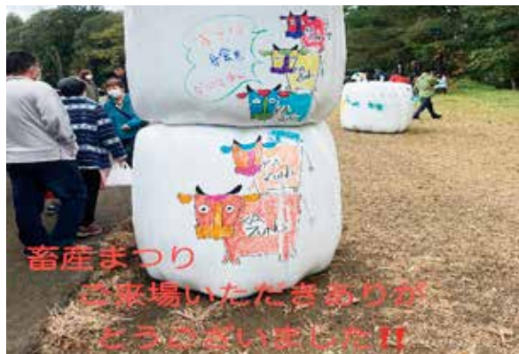
乾草ラップへのアート作品