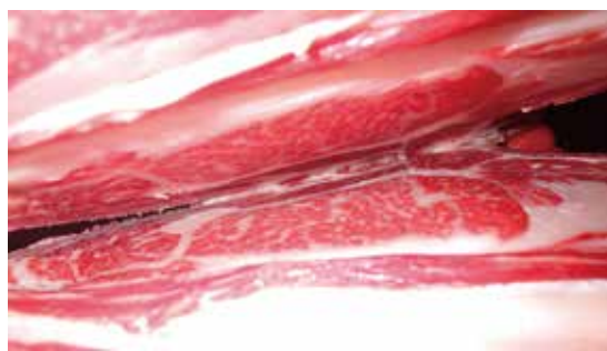
マーケットニーズ賞 断面

枝肉重量450.5kg、ロース芯面積53cm 2 、バラの厚さ6.6cm、格付け等級「A3」、BMS「5」、BFS「3」でした。